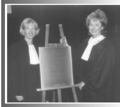
«Dévoilement de la plaque commémorative du 150 e anniversaire du Barreau de Québec.»