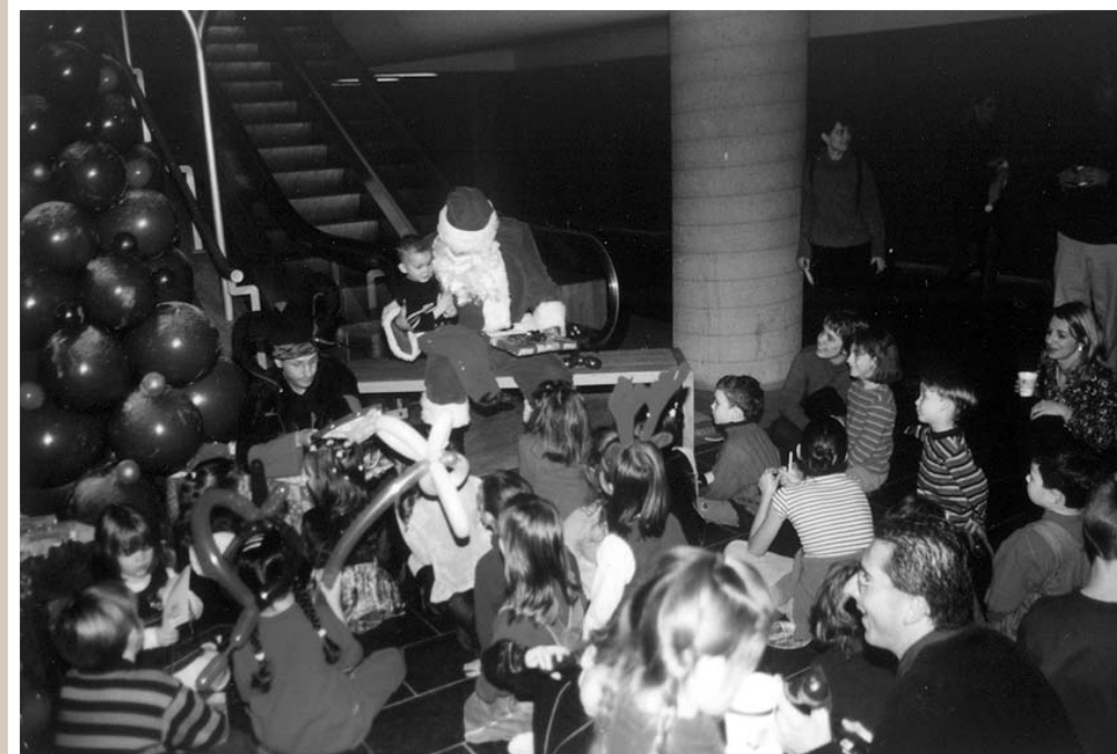
La Fête de Noël des enfants a fait plus d'un heureux encore cette année. Cette activité à laquelle participent familles d'avocats et avocates, permet de faire bénéficier à des enfants provenant de milieux défavorisés d'un après-midi de plaisir avec animation, clowns et cadeaux! Sourires garantis ! Merci aux généreux commanditaires qui rendent possible un tel évènement. ( Texte en page 7)

Envoi de publication / Port payé à Québec convention no.1526715